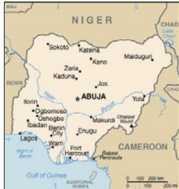
Karte: CIA World Factbook

Dem Ideal der geschlechterspezifischen Arbeitsteilung nach versorgen die Männer ihre Frauen mit Wohnraum, Kleidung und Nahrung, während die Frauen sich um die Zu-