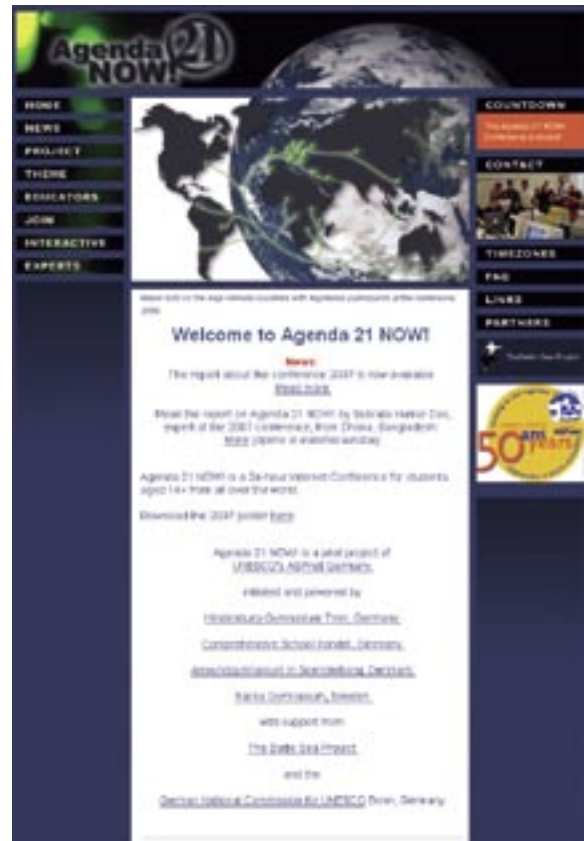
Die Internetseite von „Agenda 21 Now!“

81 % der Teilnehmer, die den Fragebogen ausgefüllt zurückschickten, fanden die Konferenz gut oder sogar sehr gut. Nur ein Teilnehmer mochte das Konferenzthema Globalisierung nicht, alle anderen fanden es zufriedenstellend oder besser.