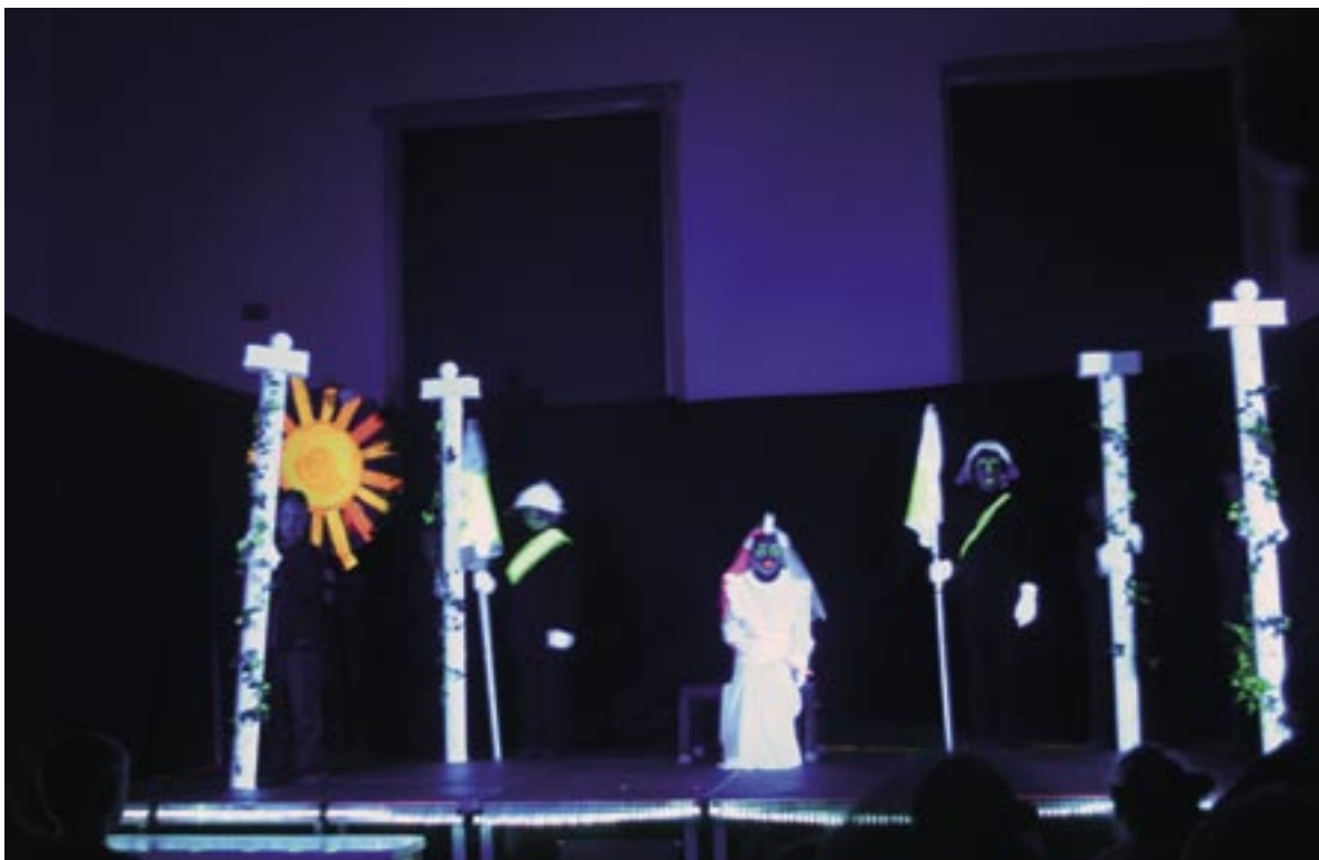
Eine Reise in die Welt der Illusion und Magie beim „Märchen vom Vogelfänger“

Bevor sich unsere Gäste vom Schwarzlichttheater verzaubern lassen konnten, wurden sie an zwei Wechselstationen von Lehrer(inne)n und Schüler(inne)n der Linné-Schule mit dem Phänologischen Garten und der Arbeit an der Schattenwand vertraut gemacht.