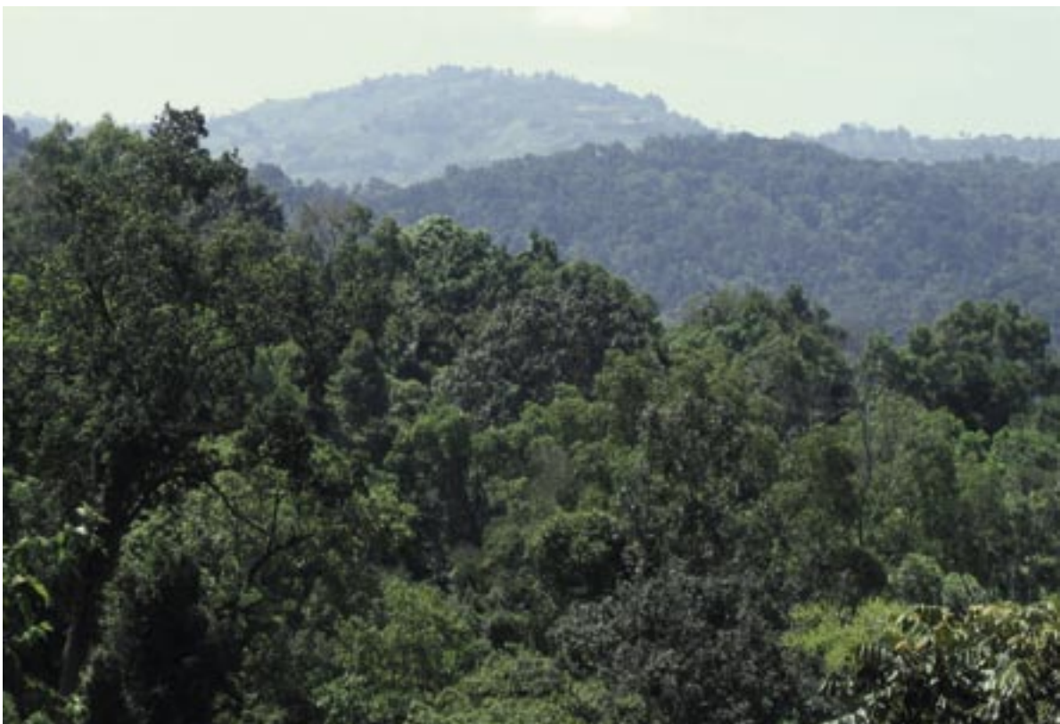
Bergregenwald im Südwesten Äthiopiens

Schutz und Nutzung von Wildkaffeepopulationen in ihrem umfassenden Biodiversitätskontext erfordert Erkenntnisse, die nur mit einem interdisziplinären Forschungsansatz gewonnen werden können, der Natur-, Wirtschafts- und Sozialwissenschaften umfasst. So sind, (1) basierend auf Vegetationsstudien, Erkenntnisse über regionale Unterschiede in der Artendiversität der Bergregenwälder vonnöten. Hinsichtlich des Wildkaffees selbst müssen (2) mit molekulargenetischen Methoden die lokalen und regionalen Unterschiede in dessen genetischer Diversität sowie die Unterschiede zu Land- und Zuchtsorten nachgewiesen werden. Kaffeezüchter interessieren Eigenschaften des Wildkaffees wie (3) Toleranz gegenüber Wassermangel oder (4) Krankheitstoleranz. Aus (5) ökonomischer Sicht muss der potentielle Wert des Wildkaffeegenpools für internationale Zuchtprogramme wie auch der Wert der Wälder abgeschätzt werden. Weiterhin