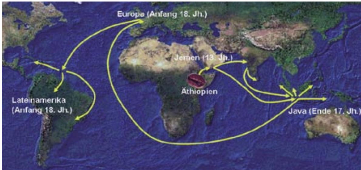
Die Verbreitung der Arabica-Kaffeepflanze über die Welt