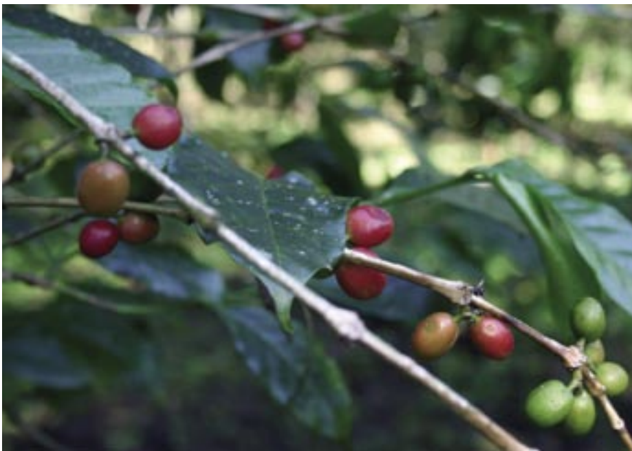
Früchte an einer wilden Arabica-Kaffeepflanze

Die Arabica-Kaffeepflanze wurde von Äthiopien über die Tropen der gesamten Welt verbreitet. Die wichtigsten Arabica-Kaffeeproduzenten sind heute Brasilien, Kolumbien, Indien, Guatemala, Honduras, Äthiopien und Mexiko.