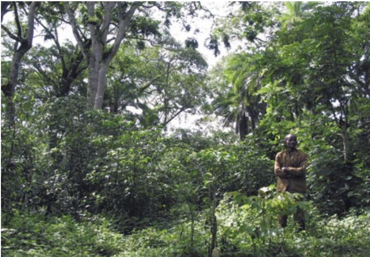
Kaffeewald: Im Unterwuchs wachsen hier vor allem Kaffeepflanzen

Da der Schutz und die Nutzung des Wildkaffees nicht losgelöst von den Wäldern gesehen werden kann, ist auch deren ökonomische Bewertung von Interesse. Hierbei soll der Wert des Waldes sowohl aus der Sicht des Bauern als auch aus gesamtgesellschaftlicher Sicht betrachtet werden. Die Analysen machen deutlich, dass aus der Sicht des Bauern die Umwandlung des Waldes in Agrarland – unter Verkauf des Holzes – profitabler ist als eine nachhaltige Waldbewirtschaftung. Betrachtet man hingegen den Wert des Waldes aus volkswirtschaftlicher Sicht, dann muss jedweder Wert des Waldes miteinbezogen werden, wie beispielsweise eine nachhaltige Holzproduktion, das Sammeln von Wildkaffee und dessen Verkauf im oberen Preissegment oder auch die Umweltserviceleistungen (z. B. Erosionsschutz, Kohlenstofffestlegung), die ein Wald bietet. Unter diesen Voraussetzungen ist die nachhaltige Bewirtschaftung des Waldes ökonomisch sinnvoller als ein ausschließlicher Schutz (ohne Nutzung) auf der einen oder die Umwandlung des Waldes in Agrarland auf der anderen Seite.