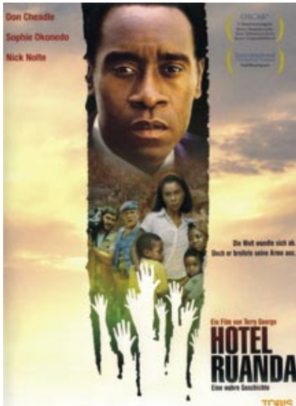
Der Film Hotel Ruanda erzählt die Geschichte von Paul Rusesabagina, der als Manager des Hôtel des Mille Collines in Kigali während des Völkermords im Frühjahr 1994 mehr als 1200 Menschen rettete

alle versagt. Es lohnt sich, die unterschiedlichen Akteure bzw. eben „Versager“ einzeln anzusehen. An dieser Stelle sollen nur wenige mit ihren Motiven herausgegriffen werden.