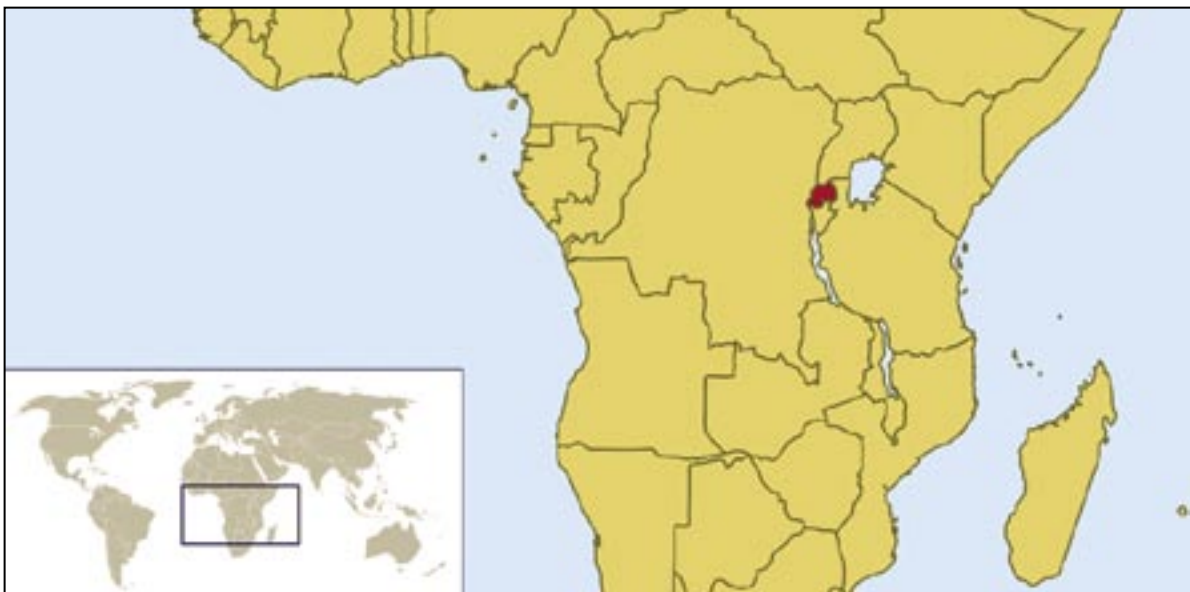
Karte: Vardion, Wikipedia

Für die Täter und die Täterinnen beginnt nun die „Arbeit“ – so nennen sie es, und sie halten dabei sogar die Mittagspausen ein. Wie es aussieht, wird es sich auch materiell auszahlen, denn der Lohn reicht von den Schuhen bis zu den Häusern ihrer Opfer. Die Ideologen und Organisatoren haben in