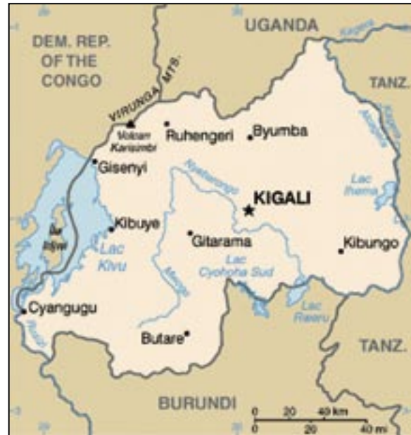
Karte: CIA World Factbook

Die meisten Menschen waren Bauern, bauten Nahrungsmittel an und hatten mehr oder weniger Kleinvieh oder Rinder. Nur wenige lebten ausschließlich von ihrem Viehbestand. Wie man auch wirtschaftete, man lebte in den meisten Landesteilen zusammen, mit klimatisch bedingt unterschiedlicher Verteilung. Wie Familien